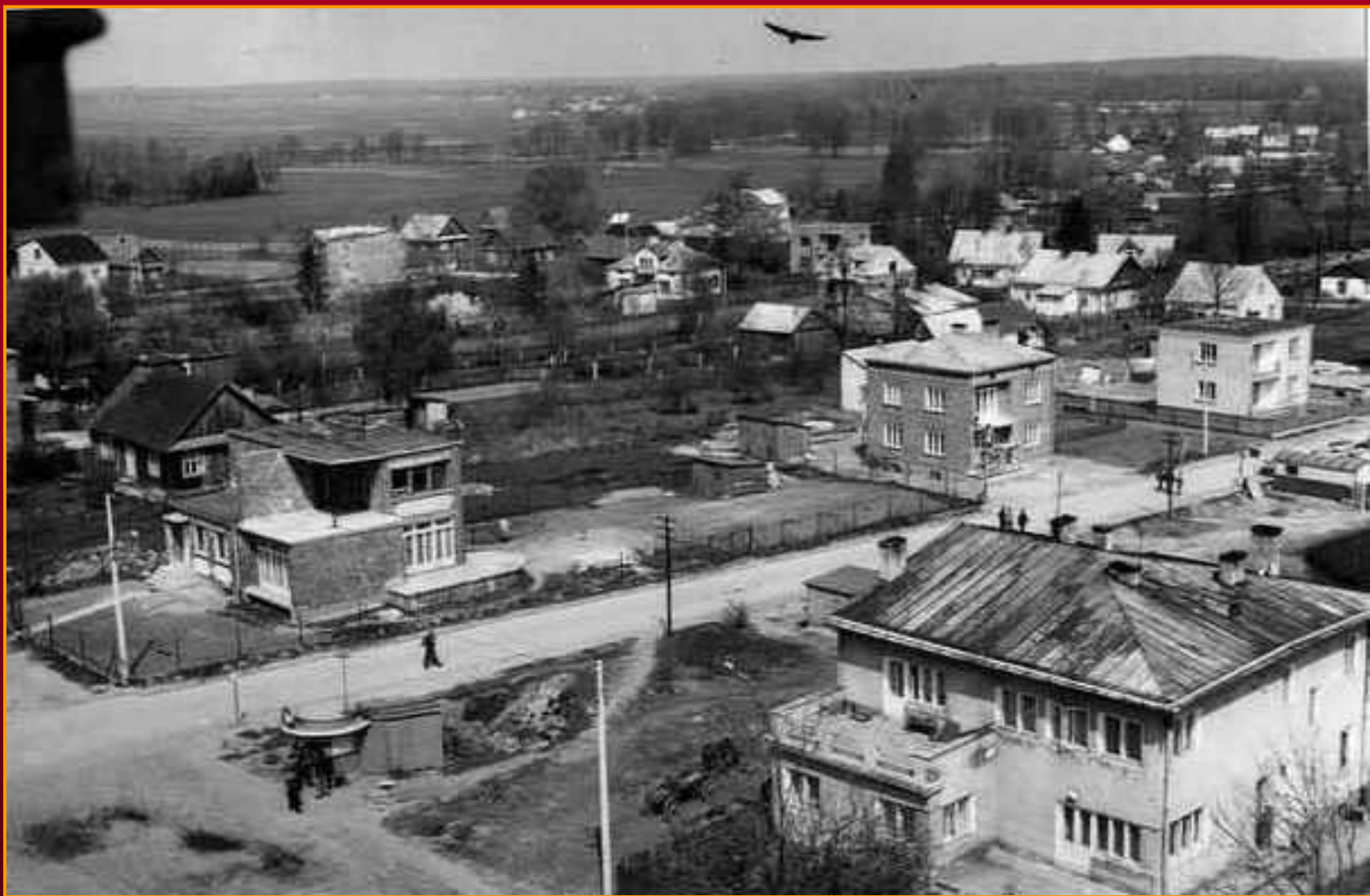
פנוראמה בילגוראית פסטורלית משנות השישים. Pastoral Bilgoraj Panorama in the sixties.