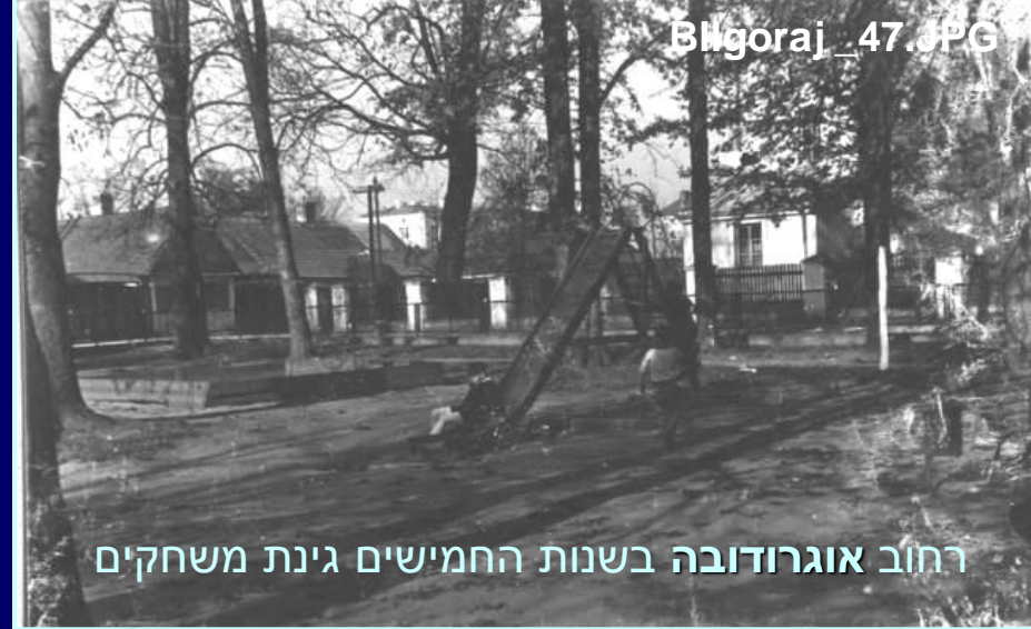
רחוב אוגרודובה בשנות החמישים גינת משחקים