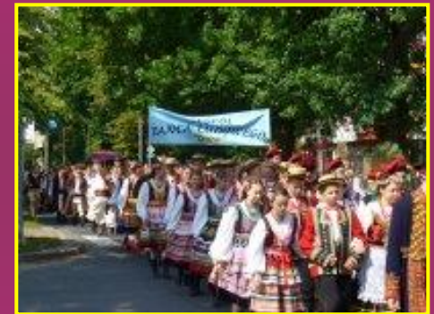
תהלוכה דתית היום