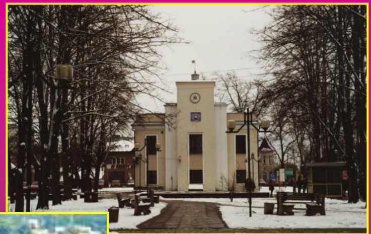
מבנה חברת החשמל