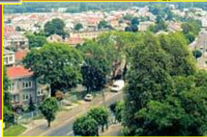
המרכז המסחרי של העיירה היום