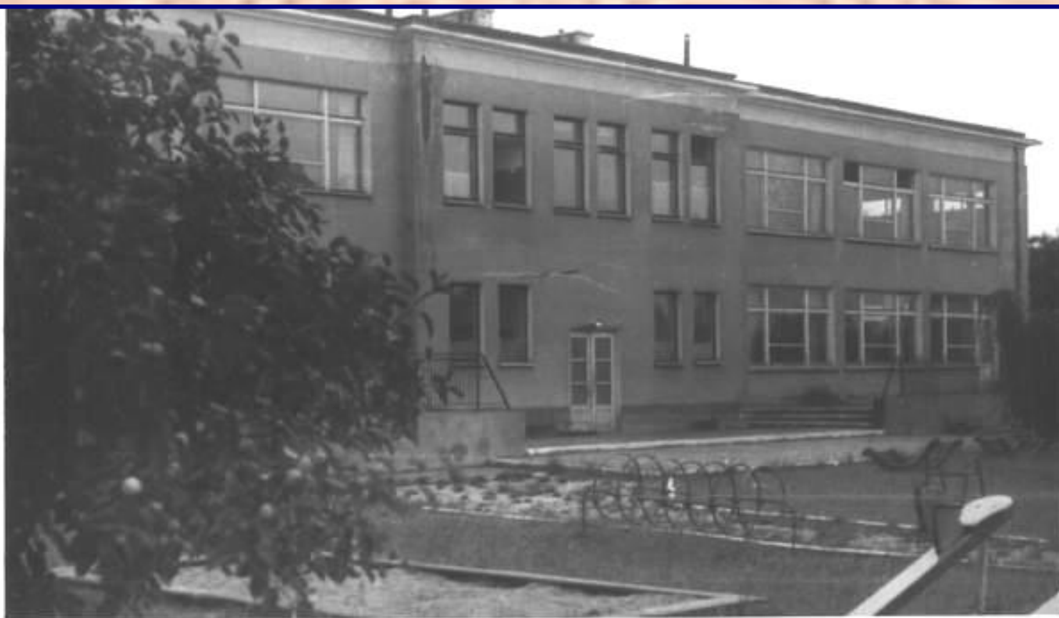
Państwowe Przedszkole w Biłgoraju

Governmental Kindergarten גן ילדים ממשלתי