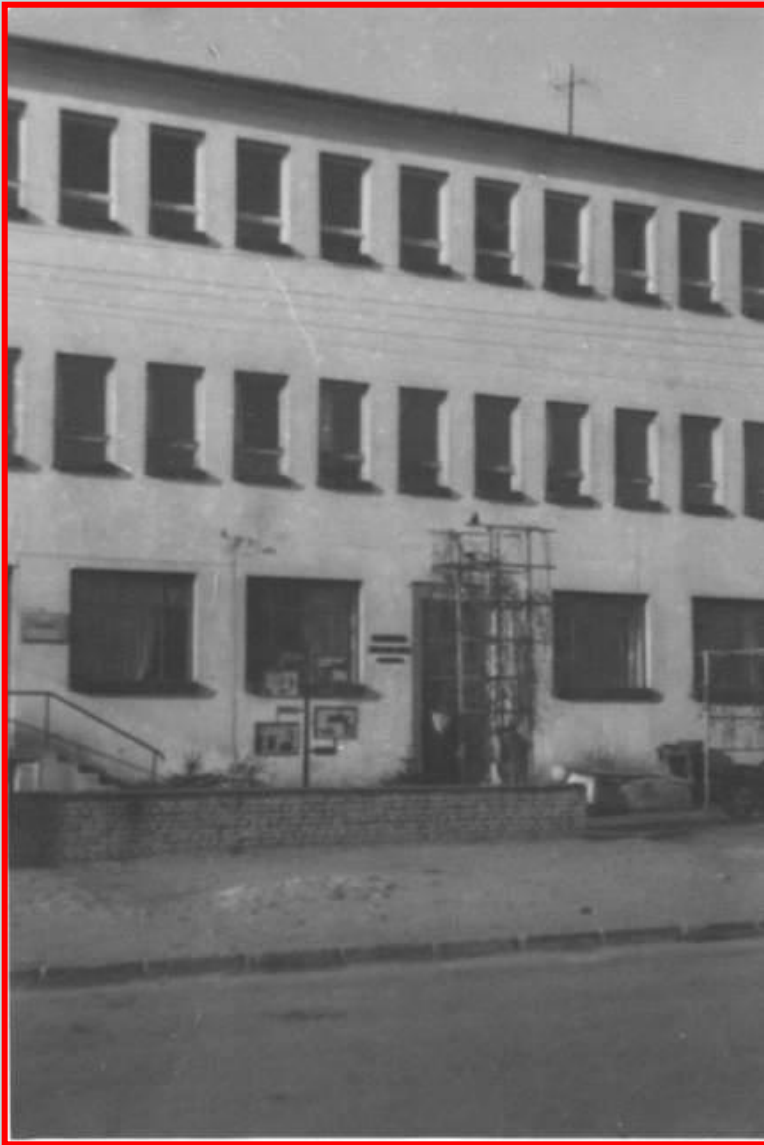
בית המשפט החדש New court of law