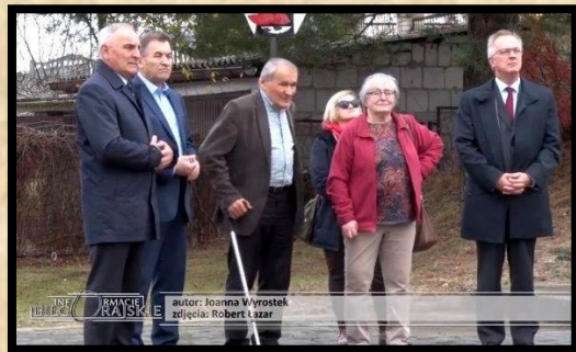
חברי ארגון התרבות ע"ש בשביס זינגר וראש העיר