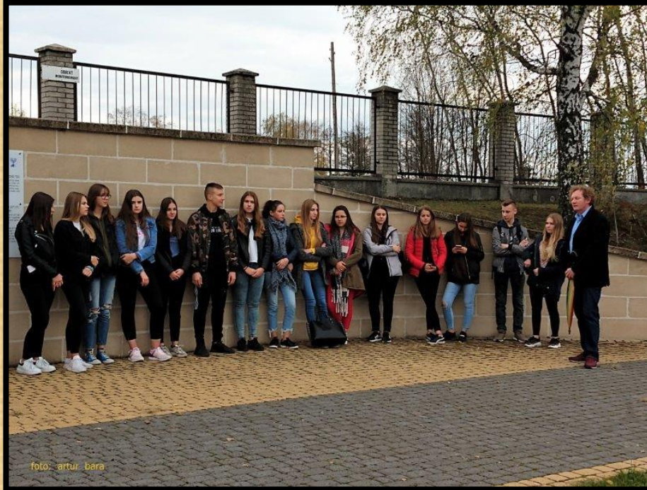
ילדי בית הספר בטקס האזכרה