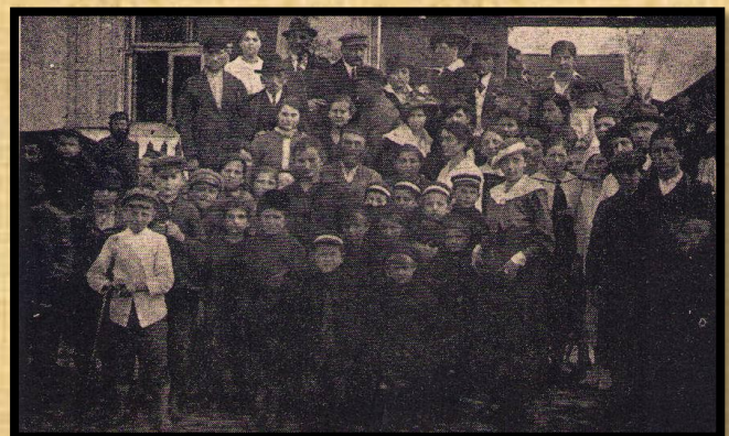
חורבן בילגוראיי עמ' 82 היתומים בשעת ארוחה חורבן בילגוראיי עמ' 83 ועד בית היתומים והילדים שימו נא לב שיתומי הבית הולבשו בתלבושת אחידה, וליד מימין יש אפילו חיית מחמד.