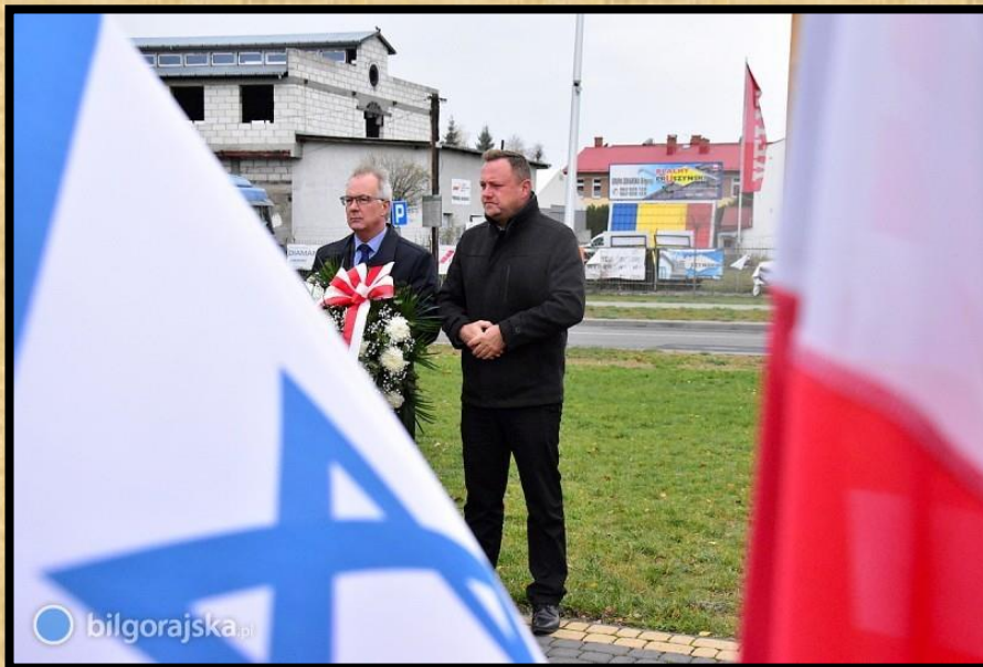
כתבה נוספת מהעיתון ואתר האינטרנט bilgorajska