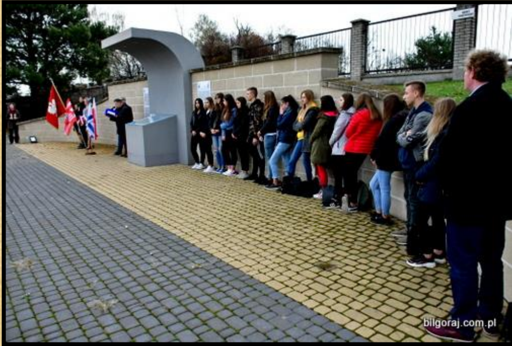
מן העיתונות המקומית

אזכרה בבילגוראיי ליהודי העיירה חומר נוסף שהתפרסם בעיתונות ובטלוויזיה. [לחץ על התמונות] חומרים אלו הגיעו אלי מאוחר יותר, ולכן, אף שהם משלימים ועוסקים באותו נושא שפירסמתי בדף העידכון הקודם הרי שלא נכללו בו אז ועכשיו אני מפרסמם לראשונה בשל חשיבותם וכדי להראות את ההדים שהאירוע עשה.