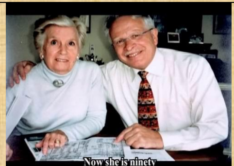
Now she is ninety