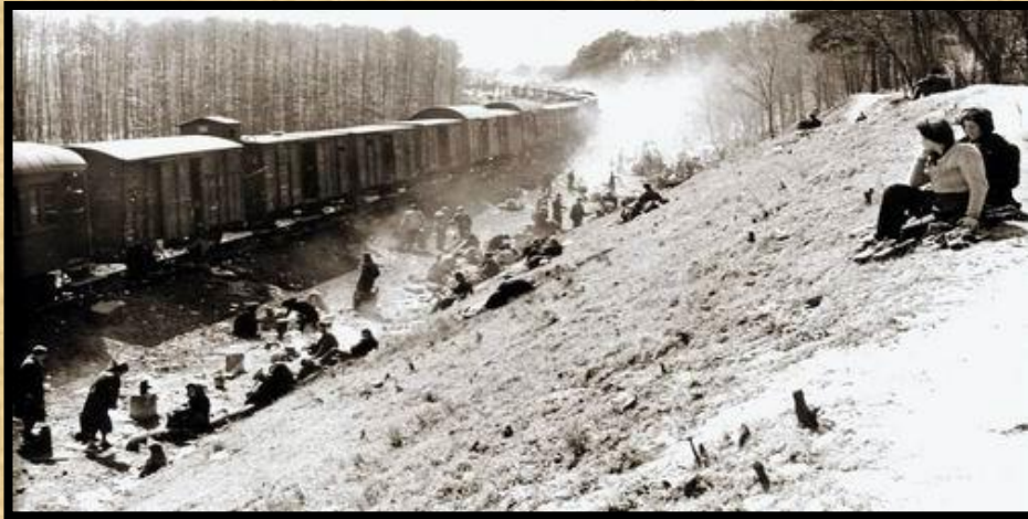
ניצולים נחים על סוללה ליד המקום שהרכבת נעצרה.

ב- 13 באפריל 1945 עלו כוחות אמריקנים מגדוד הטנקים 743 וחטיבת החי"ר ה-30 של הצבא התשיעי בארה"ב על רכבת תקועה על מסילת הברזל ליד העיירה פרסלבן, סמוך לעיר מגדבורג. הרכבת שהייתה ממחנה ברגן בלזן אמורה הייתה להגיע לטרזנשטאט, היו בה קרונות בקר וגם מכוניות נוסעים. והיא נשאה בתוכה בערך 2,500 אסירים, בעיקר יהודים, שהוחזקו כבני ערובה במחנה הריכוז ברגן בלזן. האס.אס ומשרד החוץ של גרמניה הנאצית קיוו להחליף את בני הערובה בעצירים אזרחיים גרמנים במדינות זרות, אך עם נפילת ברגן-בלזן, פונו האסירים למזרח. רכבת זו הייתה אחת משלושה שעזבו את ברגן בלזן בין 6 ל 10 באפריל לכיוון טרזיינשטט. רכבת אחת הגיעה לשם. הרכבת השלישית שוחררה על ידי כוחות סובייטים מחוץ לטרוביץ. עדויות מרתקות של שלושה חיילים אמריקאים שהשתתפו במבצע שיחרור זה הן בעלות זכויות יוצרים לכן איני יכול להביאן בזאת אבל ניתן לקרוא אותן באתר המצורף. http://www.13april1945.com/history אפשר לבקש תרגום לעברית לכל מי שהשפה האנגלית מקשה עליו להבין את הכתוב.