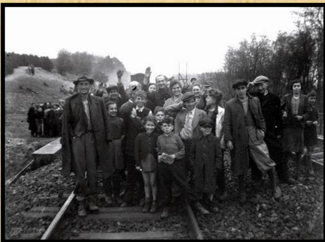
שורדי ברגן בלזן על המסילה דקות לאחר השחרור