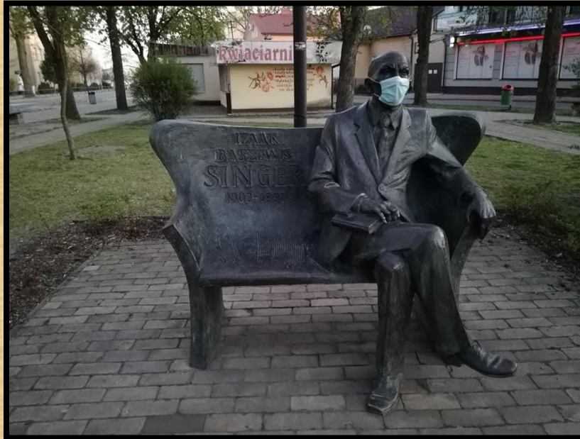
פסל יצחק בשביס זינגר