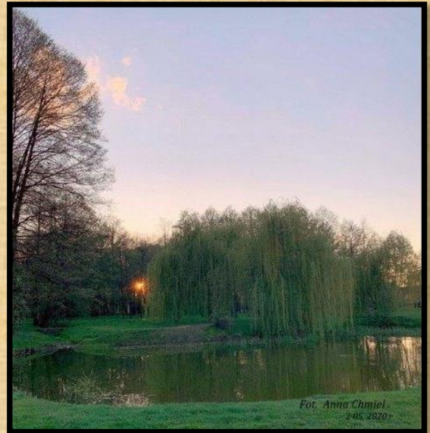
פארק המכונה "חרשת הקופים"