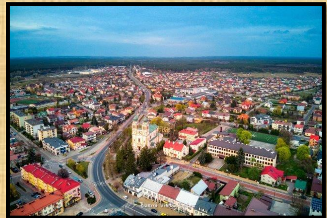
מרכז העיר מבט על, מימין בית הספר ומגרש הכדורגל שלו מקום בו היה בעבר בית קברות יהודי ומשם יצאה צעדת המוות של יהודי בילגוראיי לעיירה ד'ווירז'יניץ