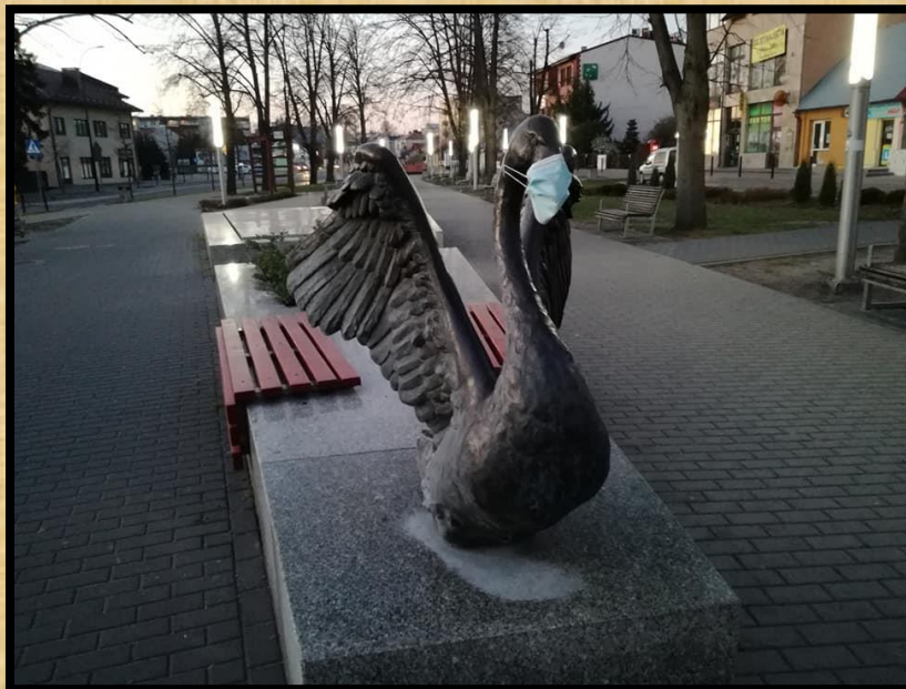
פסל הברבור מסמל העיר בילגוראיי