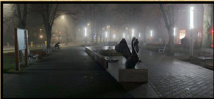
פסל הברבור [סמל העיר בילגוראיי] בלילה ערפילי