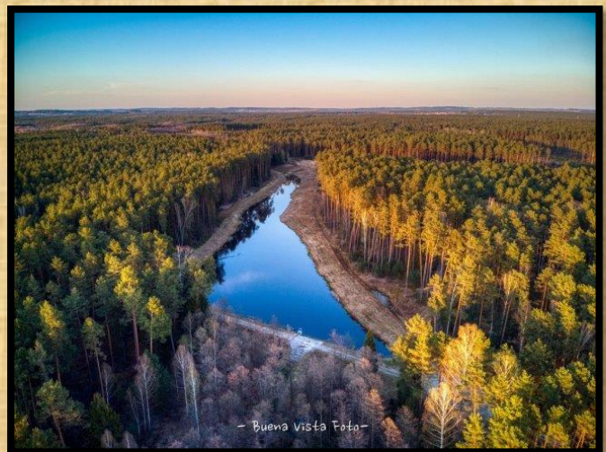
יער ראפה מיערות בילגוראיי