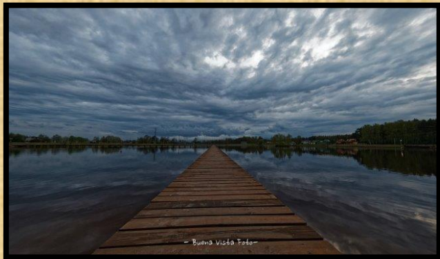
רובע בוויארה בבילגוראיי