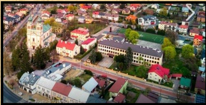
תקריב של בית הספר משמאלו כנסיית השילוש הקדוש מריה הבתולה ממעוף רחפן