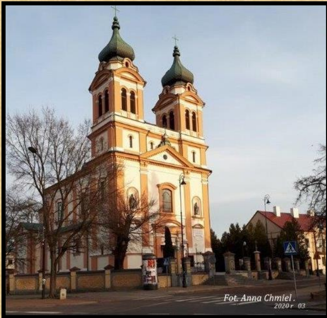
כנסיית השילוש הקדוש מריה הבתולה, הקהילה הקתולית העתיקה ביותר בבילגוראיי. קיימת מ 1624

לאחרונה מגיעים לידיי עוד ועוד צילומים של בילגוראיי ונופיה ממש בימים אלו. שני הצלמים הם Anna Chmiel וצילומי Buena Vista. האחרון משתמש כנראה ברחפן ולכן מסוגל לצלם מהגובה תמונות מרהיבות ובעלות זווית רחבה ופנורמית. הנה מבחר מצילומיהם: