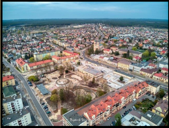
כיכר החופש ממעוף רחפן