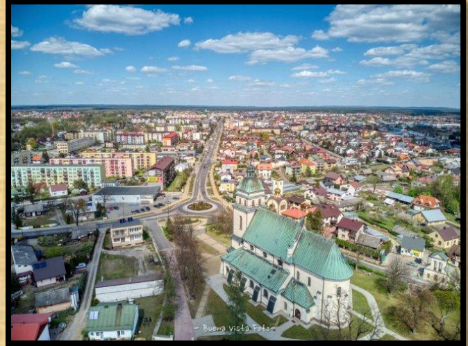
כנסיית מריה מגדלנה ממעוף רחפן