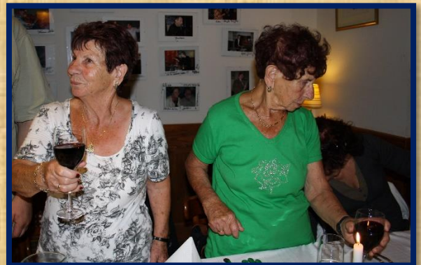
שתי האחיות בארוחת הערב בקבלת שבת בבילגוראיי