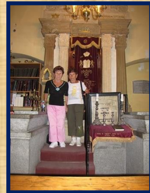
שתי האחיות בבית כנסת ברובע היהודי קיימיז' קרקוב