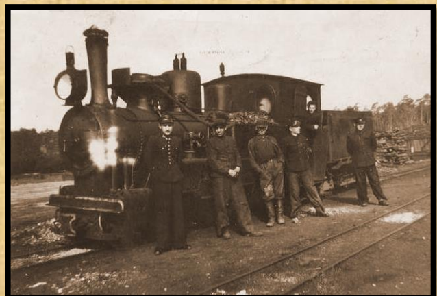
הרכבת הצרה "קאלייקע" [צוחצה] שאופיינה במסילה צרה. ואחת שירדה מהפסים