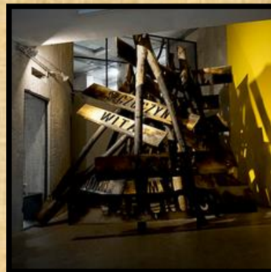
מעבודתיה של Dorota Nieznalska

אבל מסתבר שאיש זה אוחד גם בדעות נוספות של שגאה ללהט "בים. וב 2019 התבטא נגד נישואים חד מיניים שלדבריו מנישואים שכאלה יכולה להיוולד אבן-כליות ולא ילד.