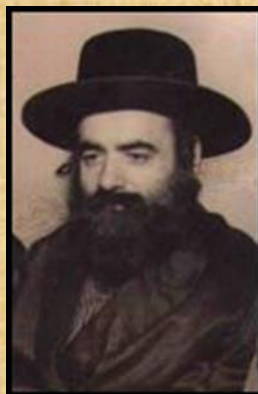
הרב מרדכי רוקח ז"ל

זאת אולי הזדמנות להרחיב את הדיבור על שני הרבנים