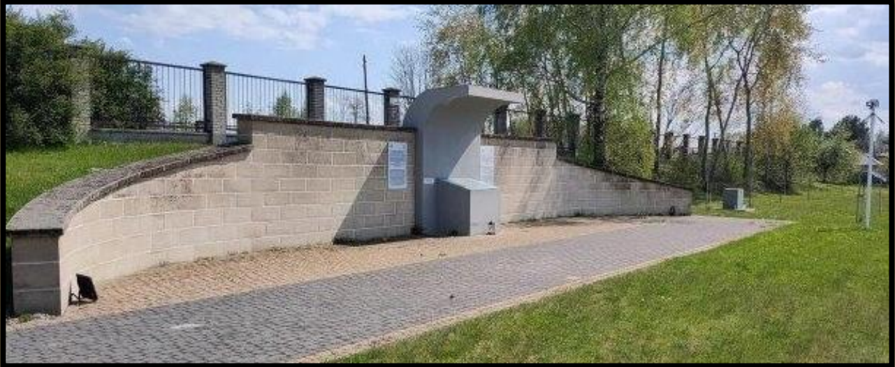
קיר הזיכרון בחזית בית העלמין באחריות ארגון התרבות ע"ש זינגר