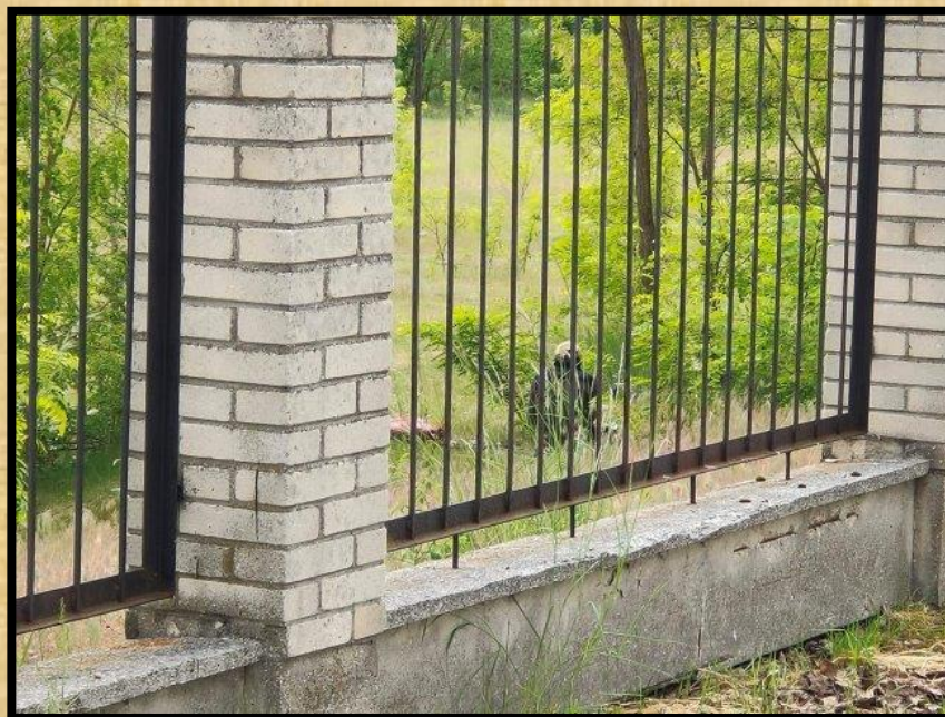
שיכור "חוגג" ליד גדר בית העלמין היהודי.