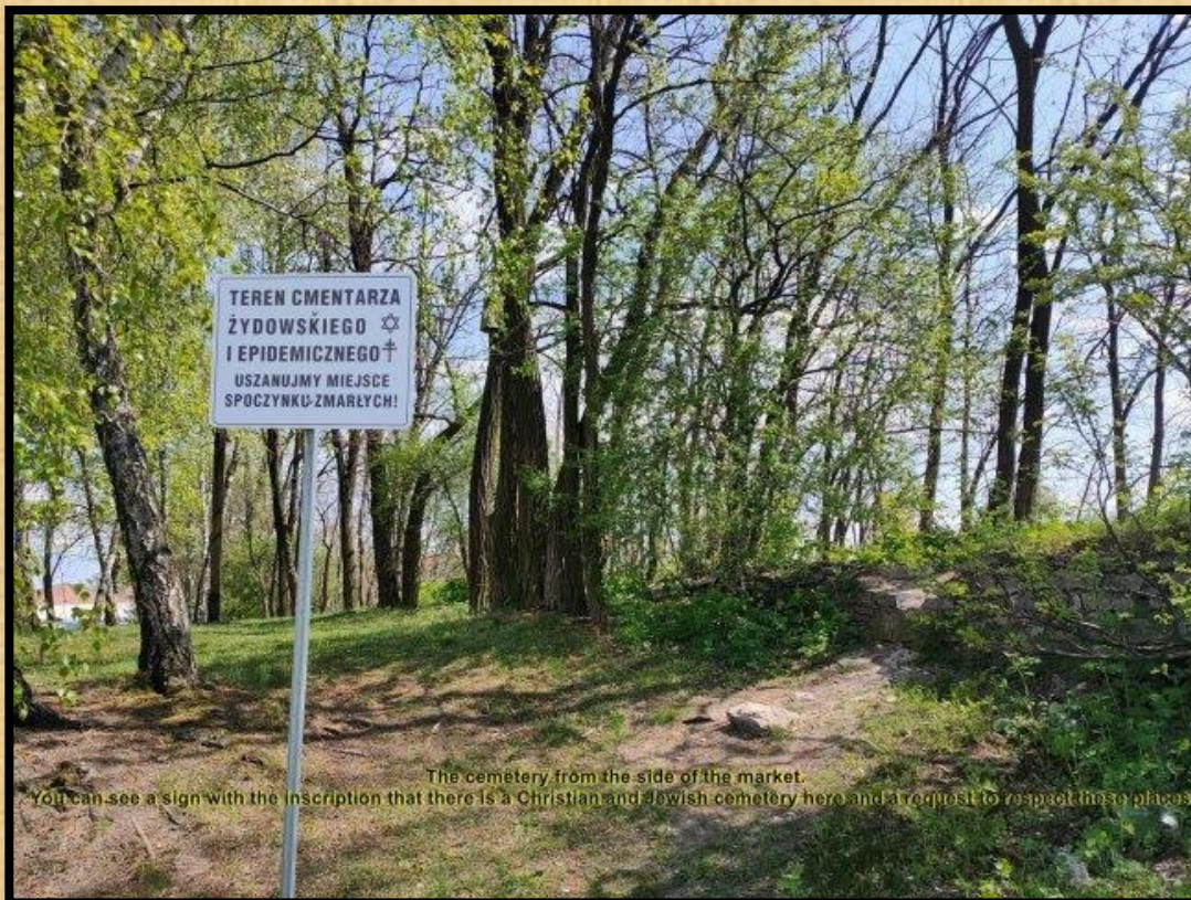
The cemetery from the side of the market. You can see a sign with the inscription that there is a Christian and Jewish cemetery here and a request to respect these places

המתחם שמעבר לגדר. בשלט נכתב שיש בקרבת מקום בתי עלמין יהודי ונוצרי ושיש לכבד את המתים.