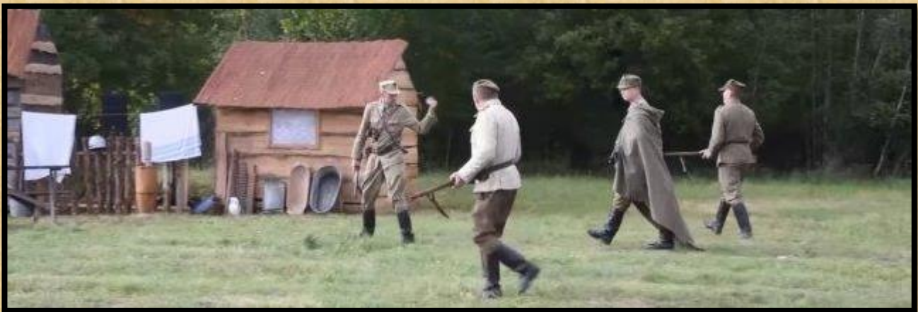
הגרמנים מגיעים לכפר

המיוחד באירוע זה הוא שהתיאטרון הוא תיאטרון חוצות, והשחקנים משחקים בסביבה די אוטנטית וקרובה למציאות עליה מספרת עלילת ההצגה.