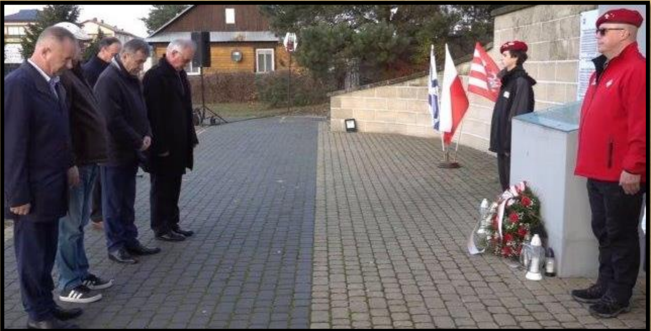
דקת דומיה וחלוקת כבוד של מכובדי בילגוראיי לקרבנות היהודים של בילגוראיי.