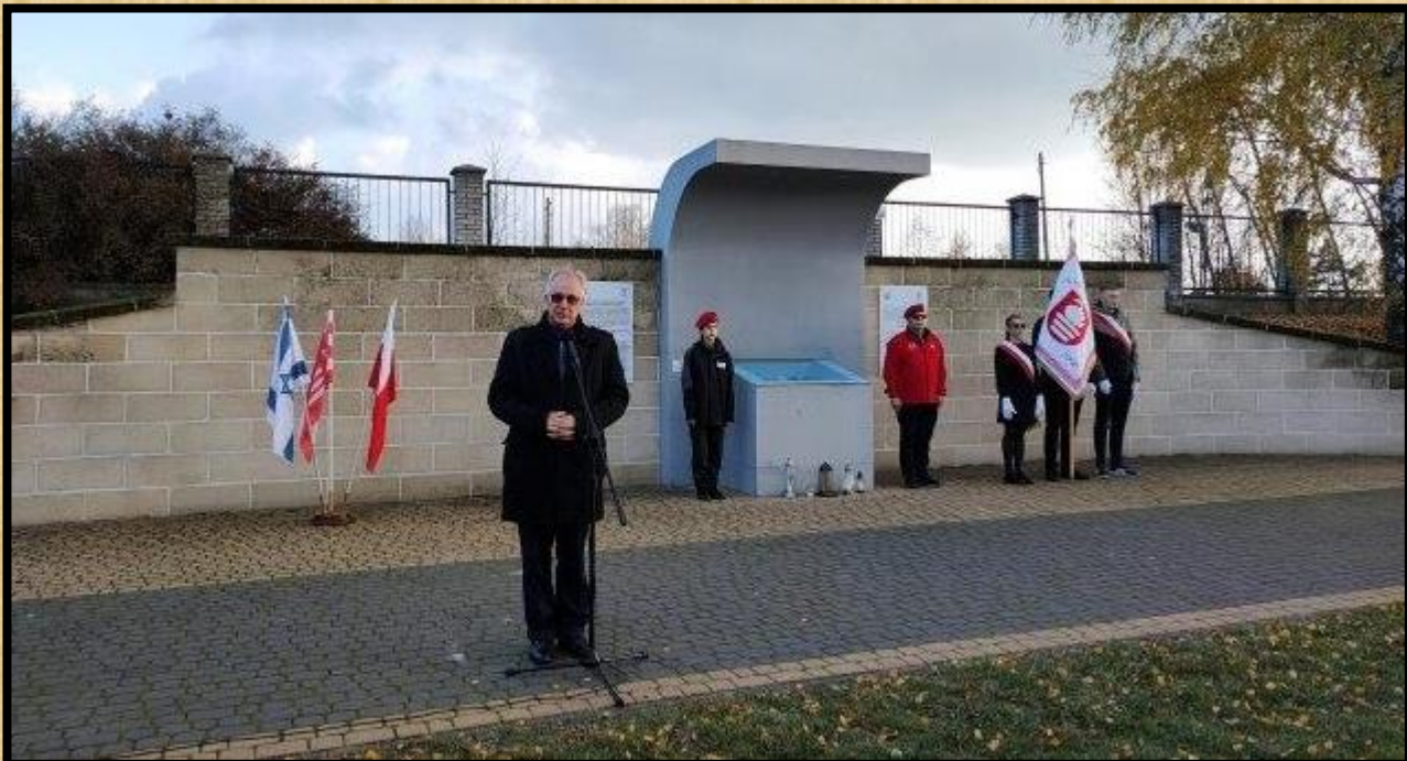
ראש העיר נושא דברים באזכרה על רקע קיר הזיכרון ומשמר כבוד.