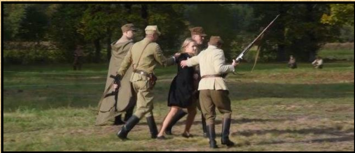
גוררים אתם אישה הרה שבורחת מפניהם.