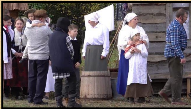
מוצאים את התושבים באלימות, התושבים מוכי תדהמה ופחד.