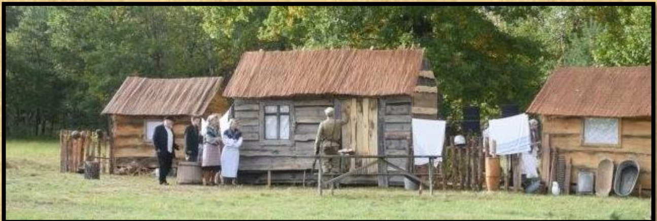
דופקים בפראות על דלת הבית ודורשים מהתושבים לצאת.