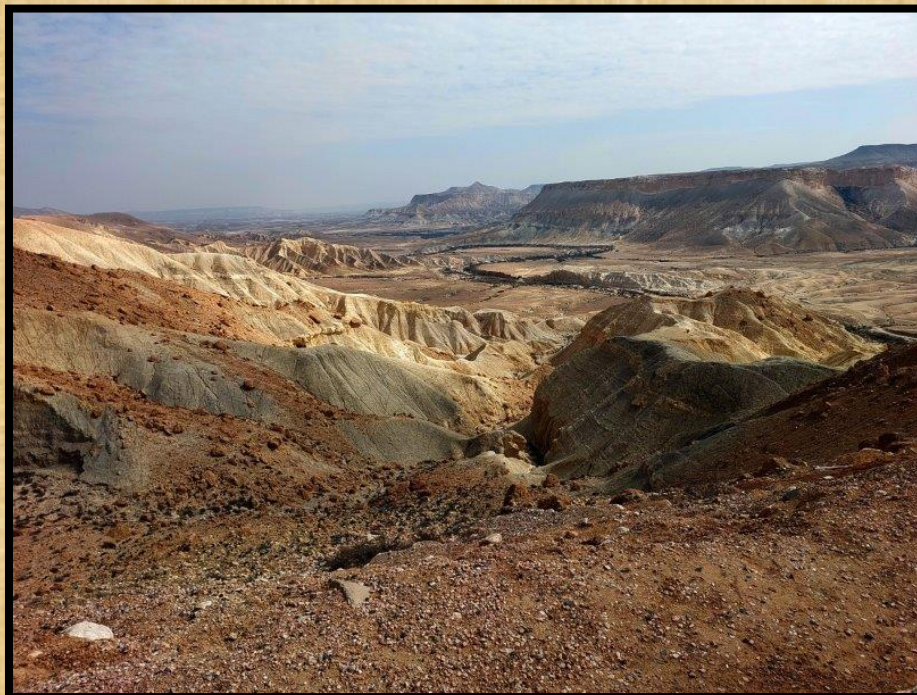
נוף המדבר ונחל צין הנשקף מאחוזת הקבר של פולה ודוד בן גוריון