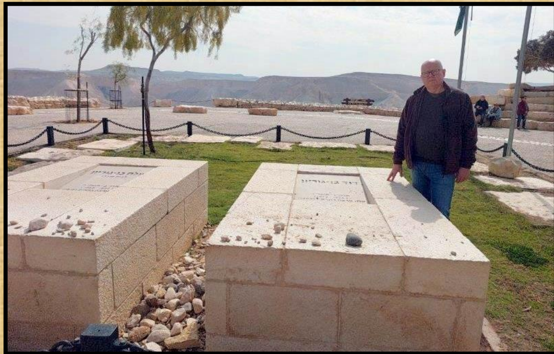
ליד קברי פולה ודוד בן גוריון