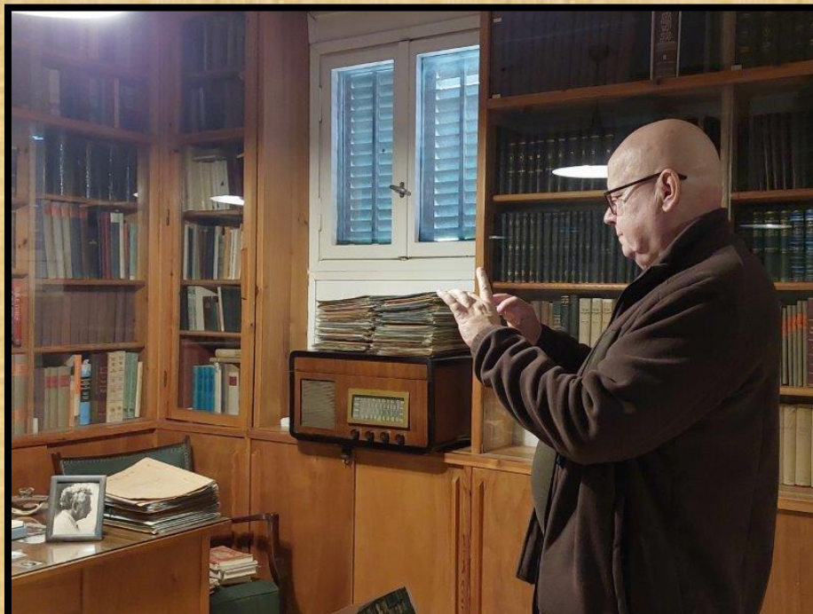
בחדר העבודה של בן גוריון