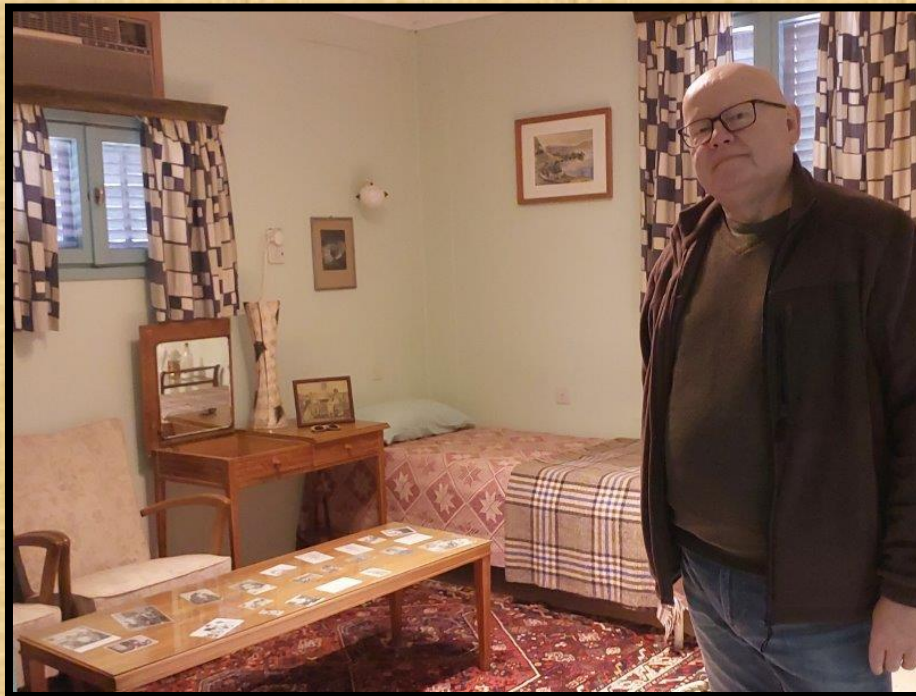
בחדר השינה של פולה.