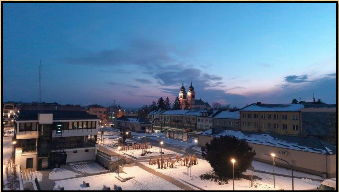
בילגוראיי בזריחה חורפית

החורף הבילגוראיי בעיצומו. לאחרונה הגיעו לידי תמונות מקסימות ביופיין של בילגוראיי המושלגת פרי עבודתיהם של צלמים המקומיים: Tom Net, Grzegorz Michalski ו-Piotr Kowalczyk.