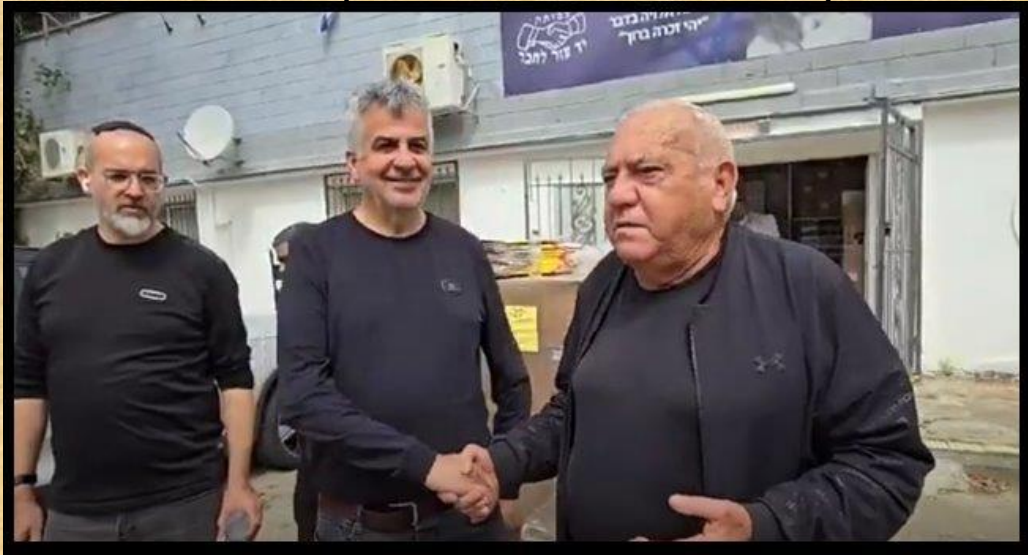
לצפייה בסרטון לחץ כאן