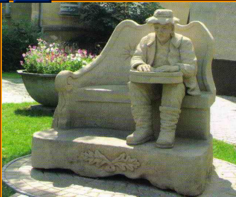
פסל של עושה נפות A Figure of a sieve maker

נפות מוכנות למכירה Nets and sieves ready to be sold